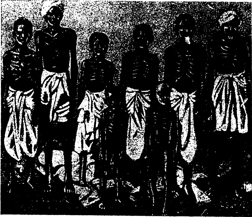
הונדערנדיקע אידישע פויערים

אלץ אין שוין און וואונדערלעך. דאָרט וואַקסן פּאַלמען, צייטיקן זיך באַנאַנעס, מאַראַנצן. דאָרט ווידמען זיך כאַיעס און פּויגלען, שטאַרקע און שיינע, אַזעלכע קאָן מען נאָר זען באַ אונז אין די זאַ- אַלאַגישע גערמאַנער, דאָרט לעבן איבערנאַטירלעכע, געהיימניס-